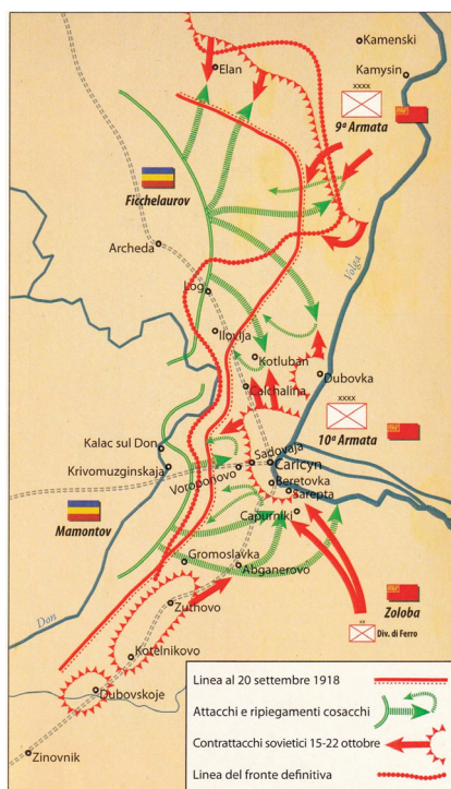
Fig.2 Seconda battaglia di Caricyn

La seconda, affidata al generale Mamontov, per l'attacco principale da ovest verso est disponeva di 25mila soldati, 156 mitragliatrici, 93 pezzi di artiglieria e ben 6 treni blindati, mezzi ritenuti ormai indispensabili per velocizzare le operazioni in quel vasto teatro di battaglia. Le riserve bianche dietro i due gruppi d'attacco erano composte da una armata di 20mila ventenni.